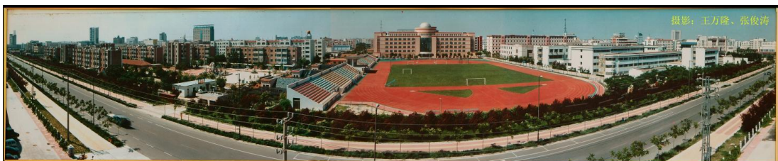
这是我校开阔美观的现代化体育场