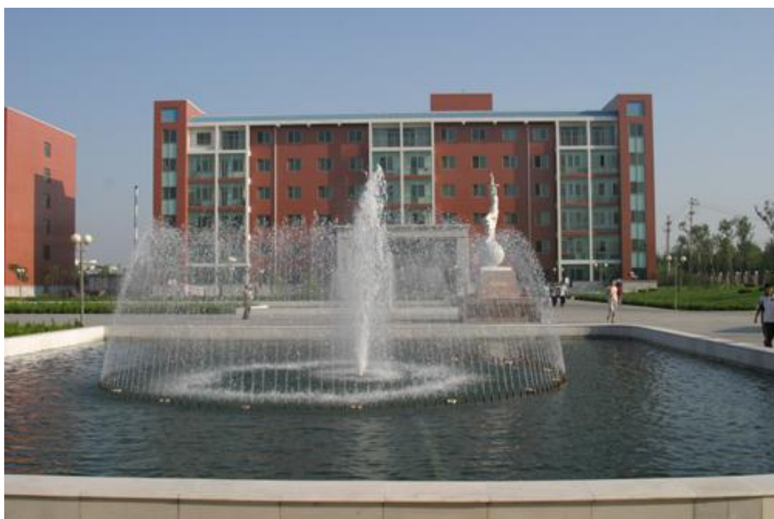
校园文化广场中的喷泉