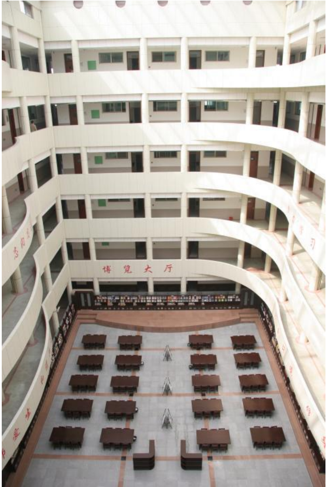
宽敞明亮的学生博览大厅