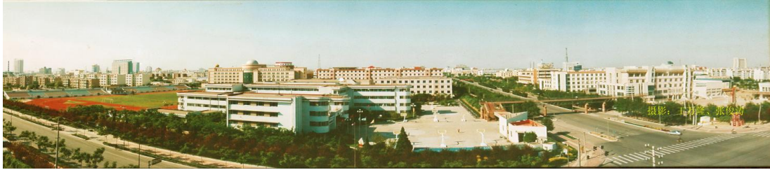
一期建设后的校园全貌