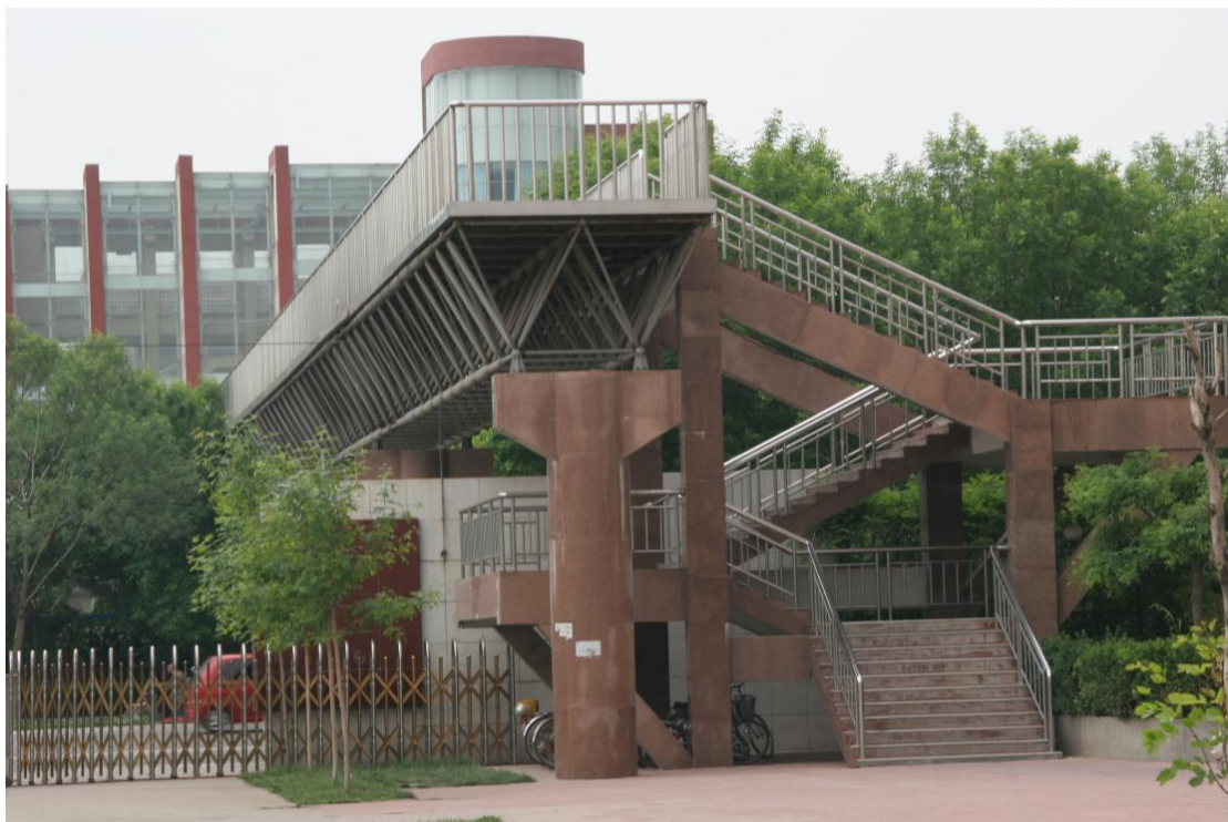
连接东西校区的天桥