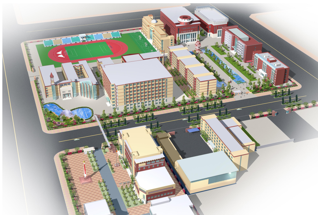
设计规划的校区鸟瞰图

完成了东院的体育馆、图书馆、老教学楼的改扩建工程和2、3号宿舍楼、实验楼、体育场的建设，总面积达3万平方米，总投资6000万元；学校规模由原来的24个班扩大到60个班，实现了第一步的校建目标。