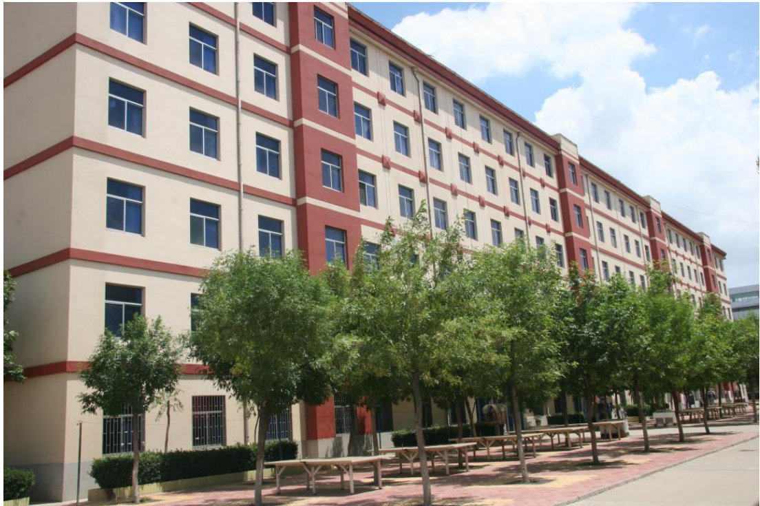
第二第三学生宿舍楼