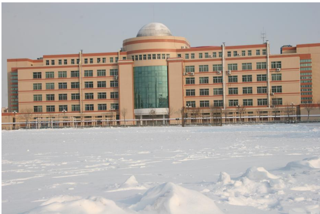
在冰雪掩映下更显雄伟壮观的综合实验楼