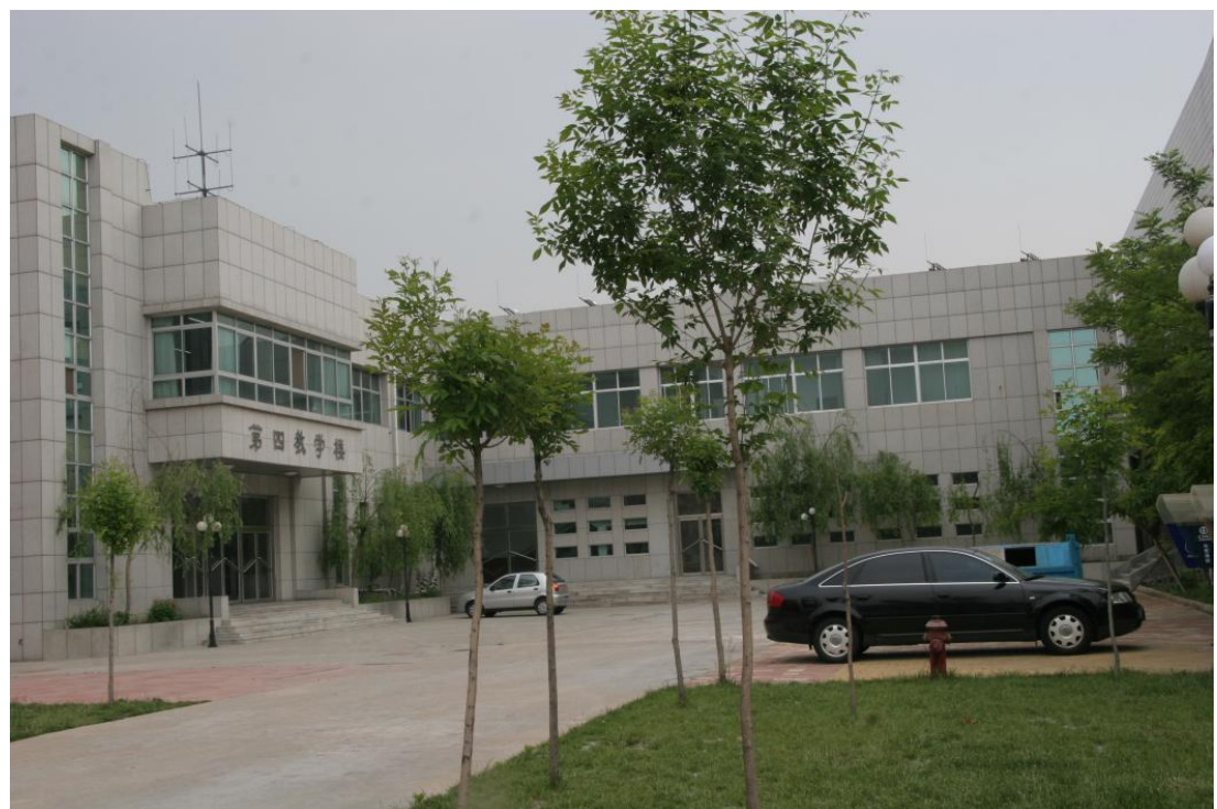
第四教学楼——艺体楼