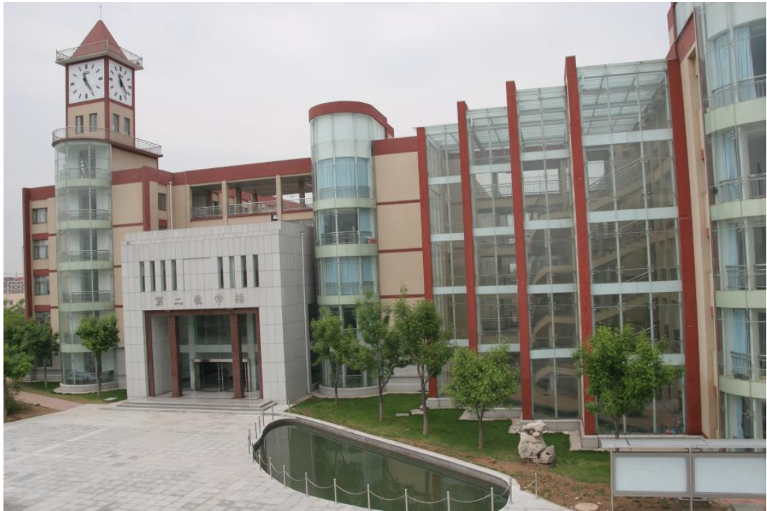
典雅舒适的第二教学楼