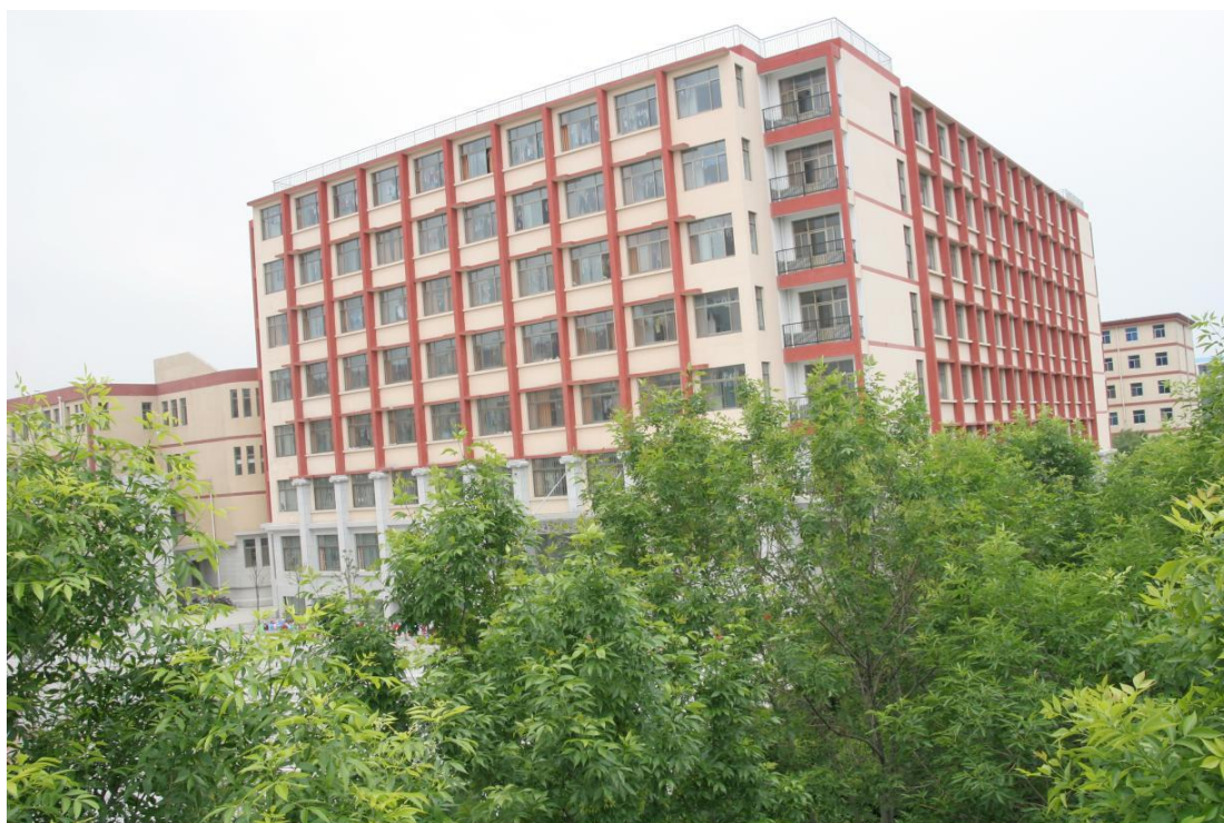
融餐厅宿舍为一体的综合楼