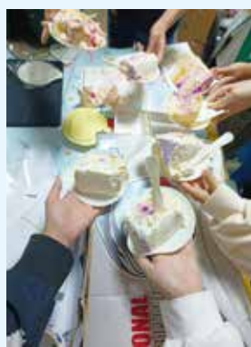
部门小朋友生日团建