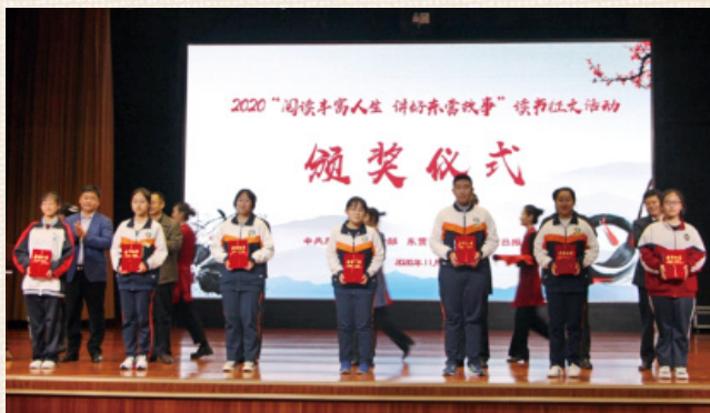
我校获奖学生代表（中间五位）上台领奖